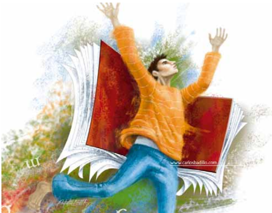
(4 a Feria Estatal del Libro, Mèxic 2005, Carlos Badillo)